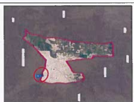
LAMINA N° 02 - UBICACIÓN DEL PROYECTO