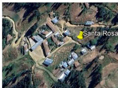
Mapa Satelital N° 04: Distrito Tayabamba Santa Rosa