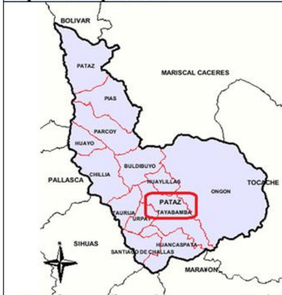
Mapa N° 03: La provincia de Pataz