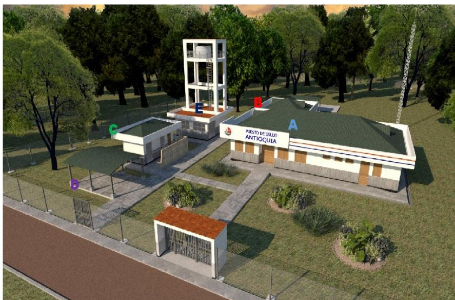
Figura: Vista panorámica, mostrando la zonificación del establecimiento de salud Antioquia

El Proyecto Arquitectónico se ha planteado su ubicación mirando frente al terreno al lado izquierdo del terreno, en el otro extremo del lado derecho del terreno hay una quebrada de escurrimiento de agua con un ancho de 2 metros y además, cruzan cables eléctrico por lo que GORE de Loreto por intermedio de la DIRESA deberán realizar los trámites para el retiro de los cables antes que se inicien las obras