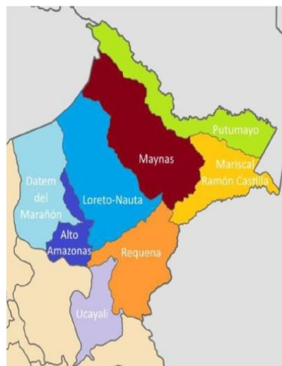
Gráfico: Ubicación de la provincia de Loreto