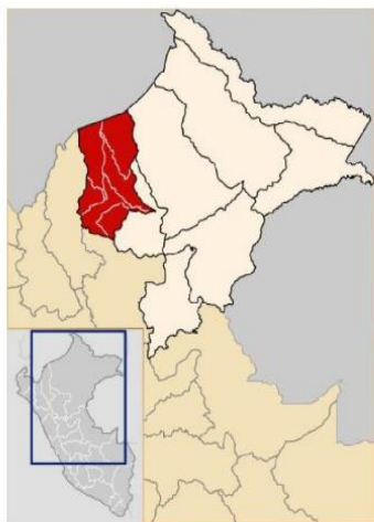
Gráfico: Ubicación del departamento de Loreto