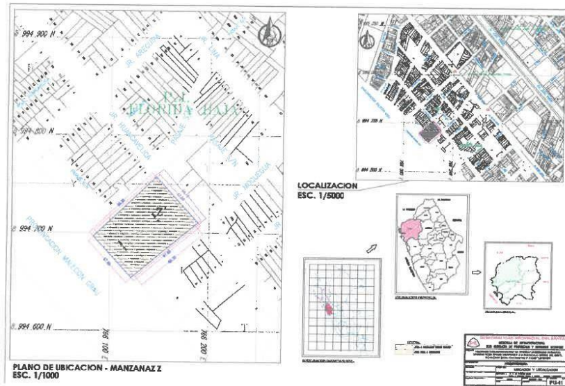
Imagen N° 01: Plano de Ubicación del Complejo Deportivo.