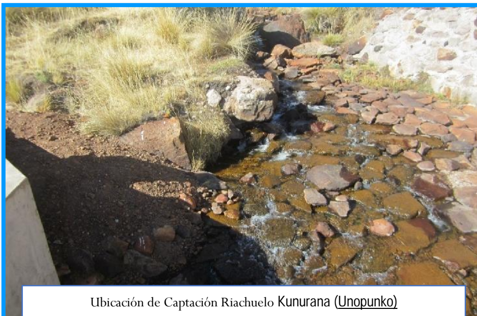
Ubicación de Captación Riachuelo Kunurana (Unopunko)