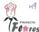
GLADIOLO RED BEAUTY

MUNICIPALIDAD PROVINCIAL DE PAUCARTAMBO GERENCIA DE DESARROLLO ECONÓMICO y AMBIENTE PROYECTO: "MEJORAMIENTO DE LOS SERVICIOS DE APOYO AL DESARROLLO PRODUCTIVO EN EL CULTIVO Y COMERCIALIZACIÓN DE FLORES EN EL DISTRITO DE PAUCARTAMBO DE LA PROVINCIA DE PAUCARTAMBO DEL DEPARTAMENTO DE CUSCO" "Año de la recuperación y consolidación de la economía peruana"