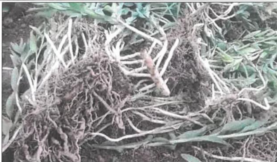
IMAGEN REFERENCIAL DE LAS ESPECIES DE FLORES DE ASTROMELIAS