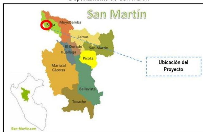
Figura N° 2: Ubicación del lugar de la obra en el Mapa político del Departamento de San Martín

Av. Alameda del Corregidor N° 155 - La Molina T: (511) 424-4488 www.gob.pe/psi