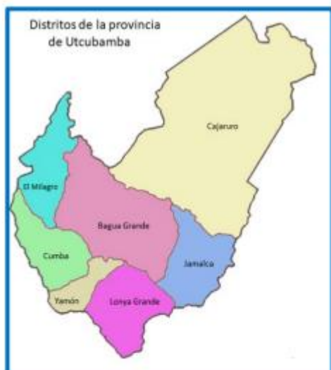
DISTRITO DE JAMALCA