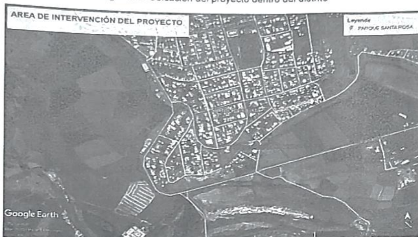
Imagen 02.- Ubicación del proyecto dentro del distrito

"Decenio de la Igualdad de oportunidades para mujeres y hombres" "Año del Bicentenario, de la consolidación de nuestra Independencia, y de la conmemoración de las heroicas batallas de Junín y Ayacucho"