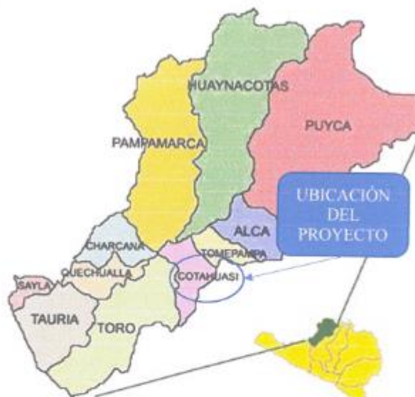
Figura 1: Ubicación Provincial del proyecto