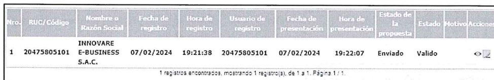
Imagen N° 01

Conforme a lo programado en el cronograma del procedimiento de selección, la presentación de ofertas (electrónica) se realizó el 07 de febrero del 2024 (00:01 a 23:59 horas). Habiéndose cumplido dicho plazo, el comité de selección procedió a verificar las ofertas presentadas a través del Sistema Electrónico de Contrataciones del Estado – SEACE, figurando lo siguiente: