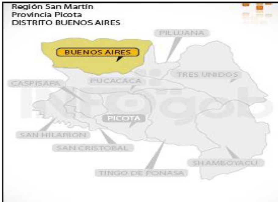
Gráfico N°3: Mapa de micro localización del Distrito de Buenos Aires.

TÉRMINOS DE REFERENCIA PARA EL SERVICIO DE CONSULTORÍA DE OBRA PARA LA SUPERVISIÓN DE LA OBRA DENOMINADA: "CREACIÓN DEL MURO DE PROTECCIÓN EN LA MARGEN IZQUIERDA DEL RIO HUALLAGA, EN LA ZONA URBANA DE LA LOCALIDAD DE BUENOS AIRES, DISTRITO DE BUENOS AIRES - PICOTA - SAN MARTÍN", CUI N°2339276