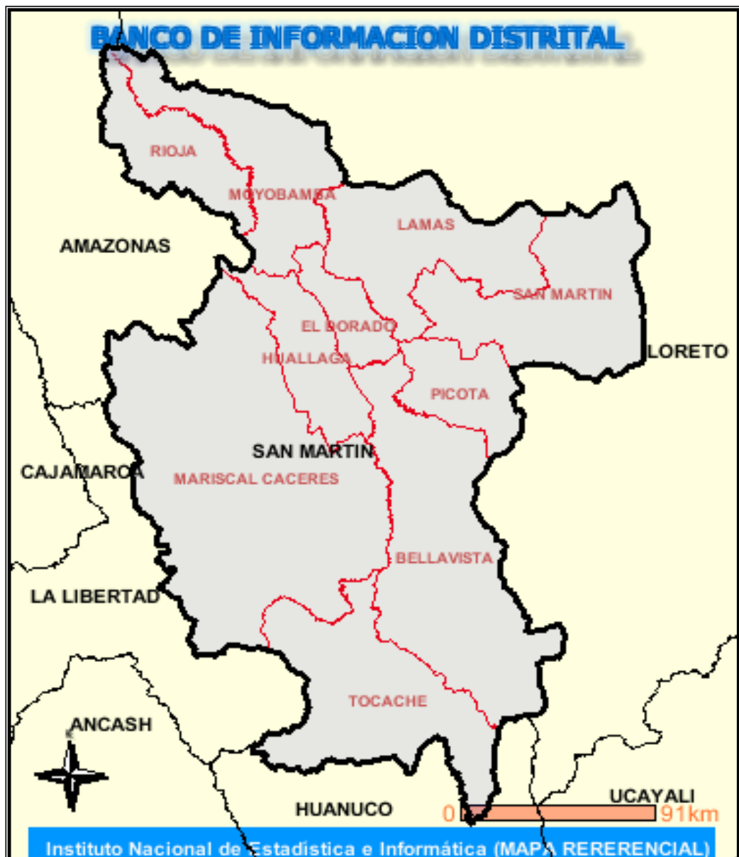
Gráfico N° 2: Mapa de macro localización de la Región de San Martín

Departamento : San Martín Provincia : Picota