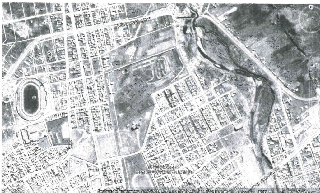
FOTO: Perímetro local UNSAAC filial Espinar-Cusco.

Distrito : Espinar. Provincia : Espinar. Departamento : Cusco.