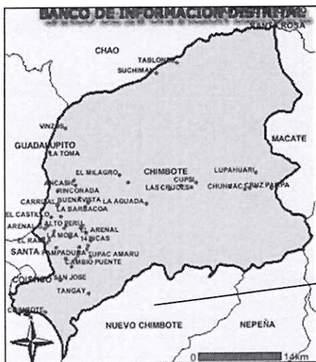
PROV. DEL SANTA