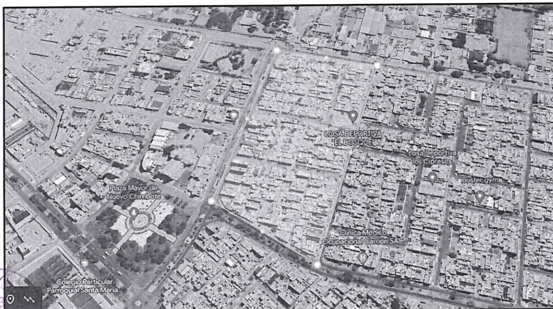
Micro Localización Google Earth - Distrito Nuevo Chimbote – URB. EL BOSQUE