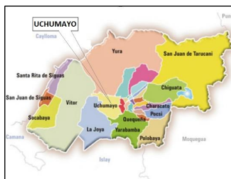
Figura N°3: Ubicación de la zona del proyecto y áreas de influencia en el Distrito de Uchumayo