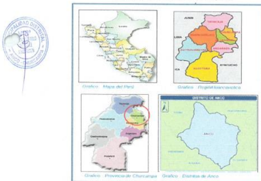
Fotografía N° 01: Ubicación del Proyecto

El proyecto está localizado en el Distrito de Anco, de la Provincia de Churcampas, del Departamento Huancavelica, tal como se muestra en la siguiente figura.