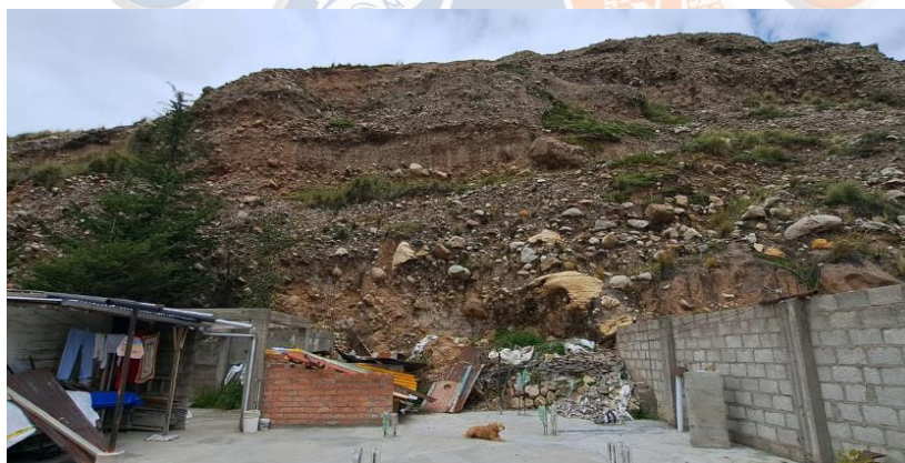
Figura N°01: Condiciones actuales del proyecto

De manera preliminar a los trabajos del presente estudio, se hizo un recorrido de estas zonas en la cual se pudo evidenciar que la caracterización geológica geotécnica del sector corresponde a bancos de areniscas cuarzosas y cuarcíticas, semimetamorfizados, masivos, muy duros, competentes, pertenecientes a la Formación Chimú en su miembro superior (Ki-chim s), con poca cobertura de Depósitos coluviales (Q-co) o de colapso (Q-cp). Condiciones geológicas y geotécnicas poco difícil para la excavación de la plataforma y taludes de corte. De acuerdo a lo anterior, las Clasificación de Materiales corresponde a Roca Fija en 60%, Roca Suelta en 20% y Suelos en 20%. Por consiguiente, los trabajos de construcción de los accesos han quedado conformados con un talud de (H: V) 1:3. En un tramo de 131.91 m de longitud y lo solicitados para los trabajos de estabilización de taludes con malla metálica corresponden a lo señalado en la ficha técnica y el presente expediente técnico.