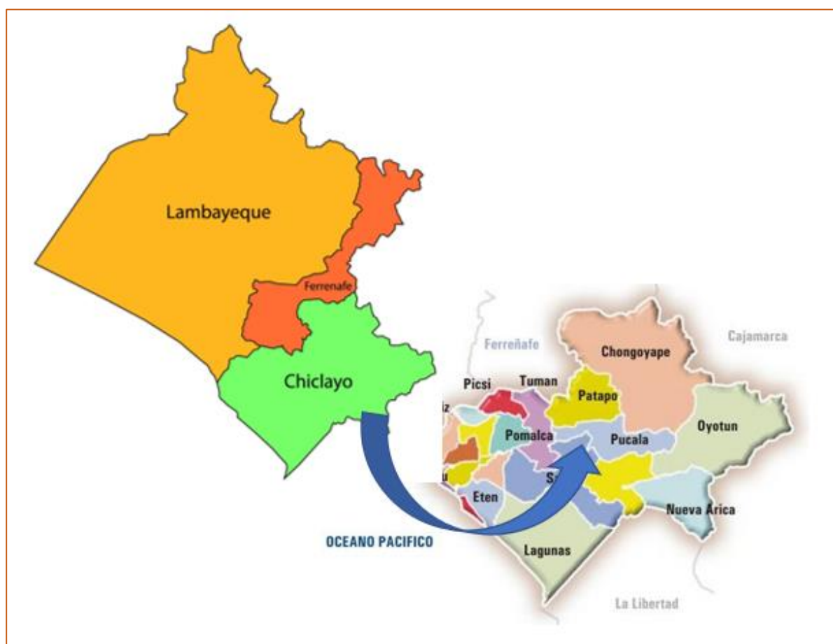
Ubicación del Proyecto GRÁFICO N° 1: Macro- Localización del Proyecto