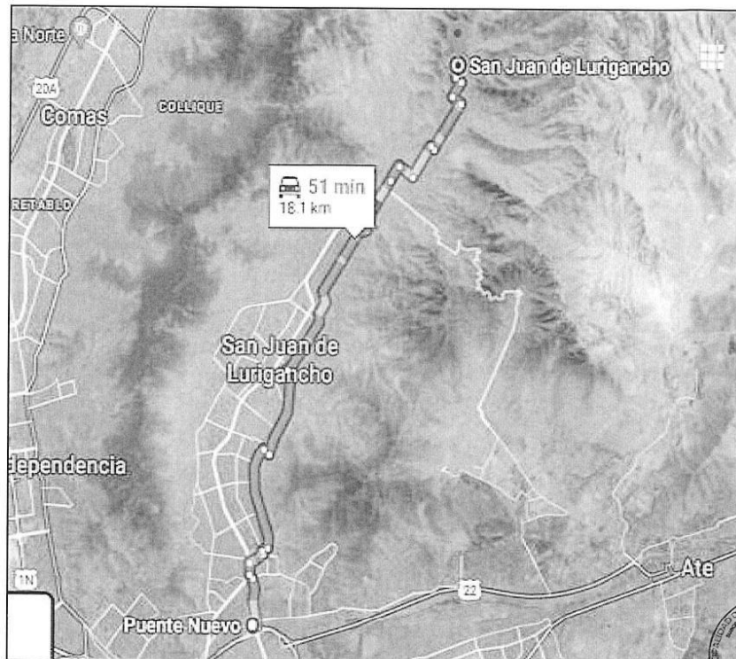
Imagen 1: Ubicación del proyecto en el Distrito de San Juan de Lurigancho.

SAN JUAN DE LURIGANCHO 001033 CAMBIA CONTIGO