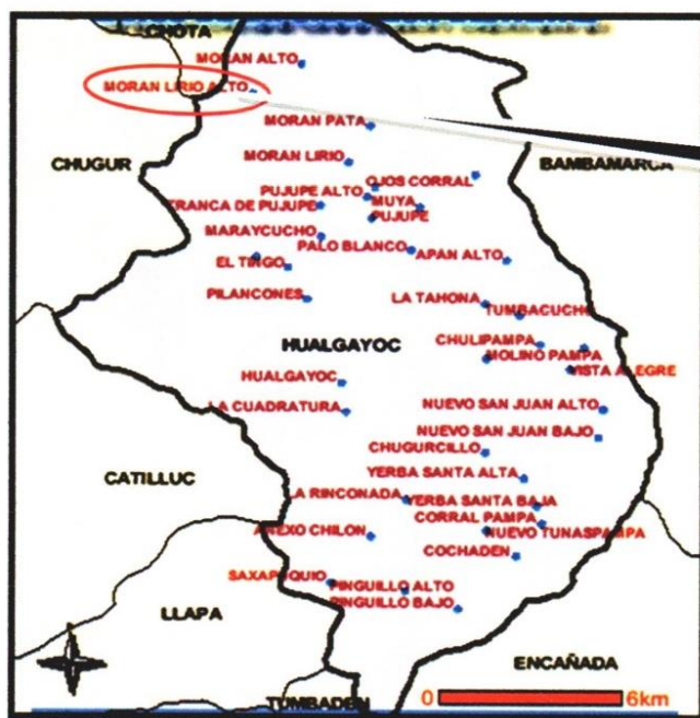
Gráfico N° 03 – Ubicación del Proyecto: Moran Lirio