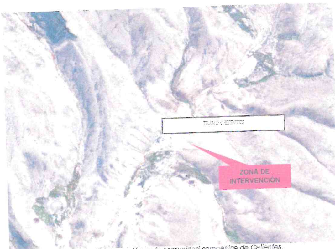
Ubicación de la zona de intervención en la comunidad campesina de Calientes.