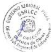
Anexo N° 14