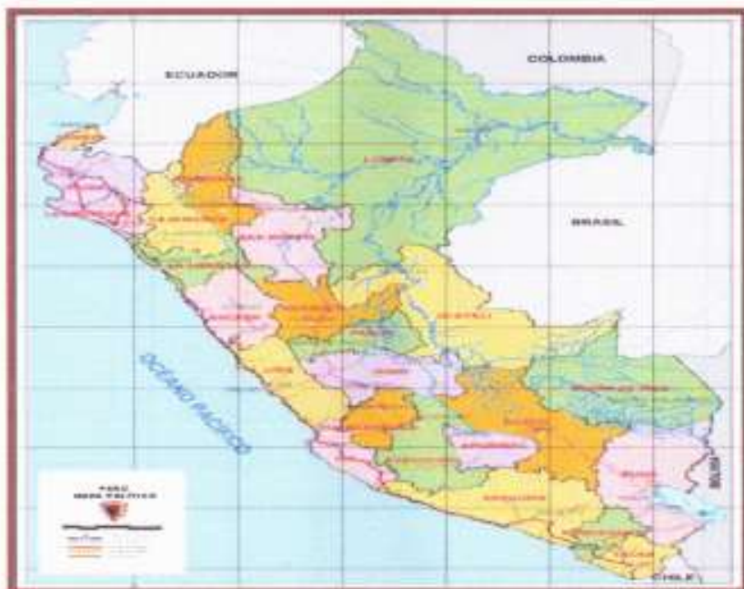
MAPA DE LOCALIZACIÓN GENERAL DEL PROYECTO