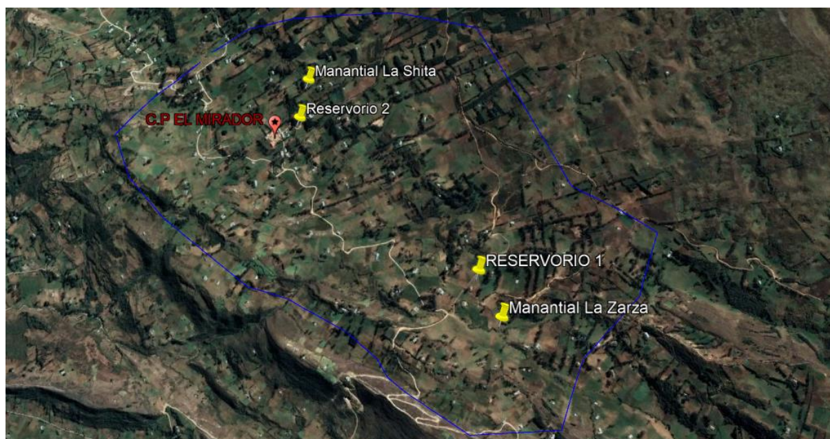
Imagen 01: Ubicación del sistema de agua el Mirador.

NOTA: Cabe mencionar que, durante el proceso de elaboración, la Sub de Estudios y Proyectos conjuntamente con el equipo evaluador del proyecto identificará más zonas de intervención, con la finalidad de enmarcar en su totalidad el proyecto y se cumpla con el objetivo, que es