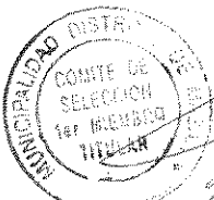
SHERMAN PIC TANGO VARGAS PRIMER MIEMBRO TITULAR