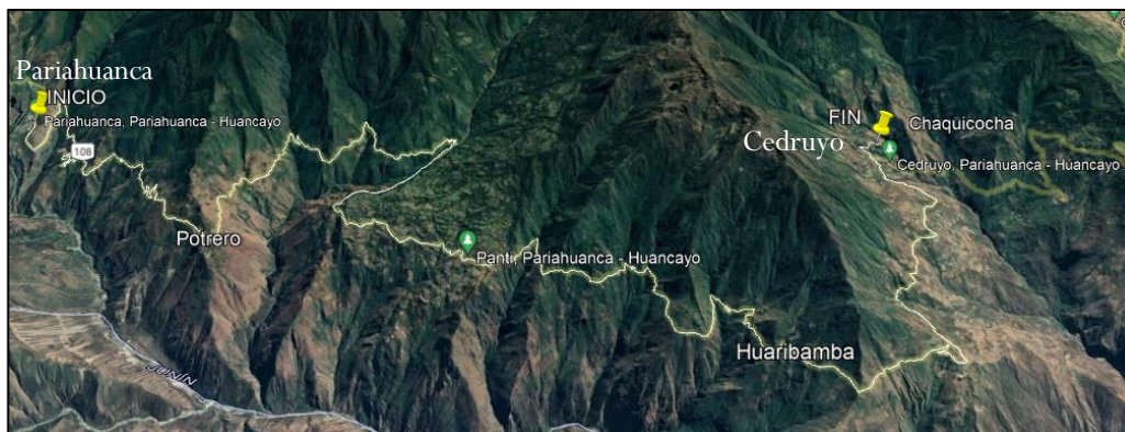
TRAMO I: PARIAHUANCA – C.P PANTI – CEDRUYO