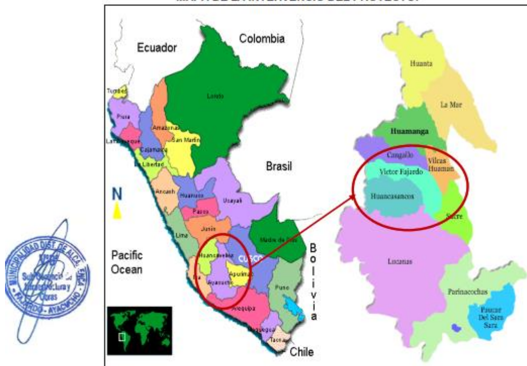
Figura 01: Macro localización del área de influencia-ubicación de la provincia de Victor Fajardo