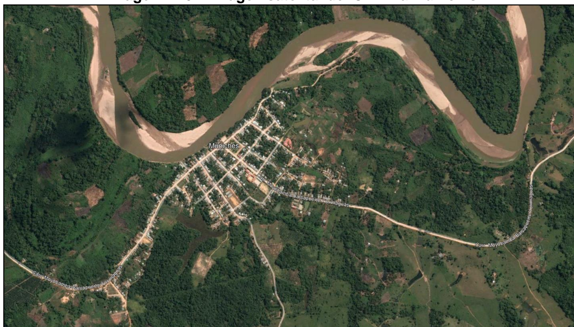
Imagen N° 02: Imagen satelital del CP Villa Munichis