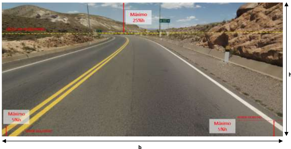
Visualización aceptada (con vista de carril)