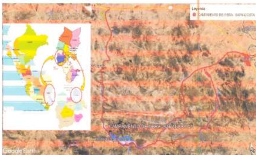
Accesos a la obra - Sapanccota

La prestación del servicio se ejecutará en un plazo de (275) días calendario y/o hasta completar las horas máquinas solicitadas a partir del internamiento de la maquinaria.