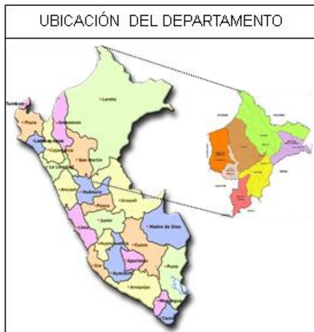
Imagen N°01: Marco de localización

IE BONIFACIO ALVARADO PAREDES - YURIMAGUAS DISTRITO DE YURIMAGUAS, PROVINCIA ALTO AMAZONAS, DEPARTAMENTO LORETO