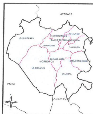
Mapa: Provincia de Morropón