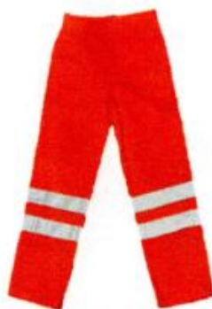
Imagen Pantalón de seguridad