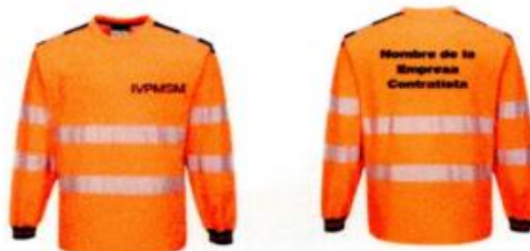
Imagen Polo Manga Larga de seguridad