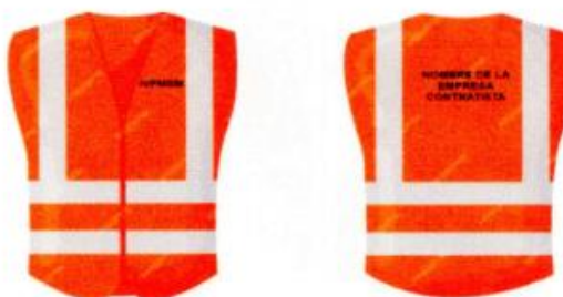
Imagen Chaleco de seguridad