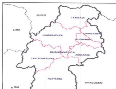
MAPA PROVINCIA TAYACAJA