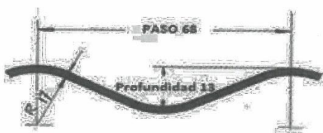
Figura 1. Dimensiones de la corruga 68 mm x 13 mm

Las corrugas de las planchas deben formar curvas suaves continuas. La corruga está designada por el paso (distancia de cresta a cresta) y la profundidad de la corruga. Tal como se muestra en la Figura 1, el tamaño nominal de la corruga es 68 mm x 13 mm para las alcantarillas TMC. En Tabla 3 se muestran los requerimientos dimensionales referentes a la corruga.