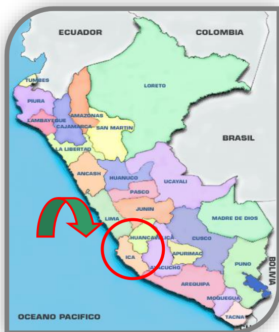
GRAFICO: 2.1.01