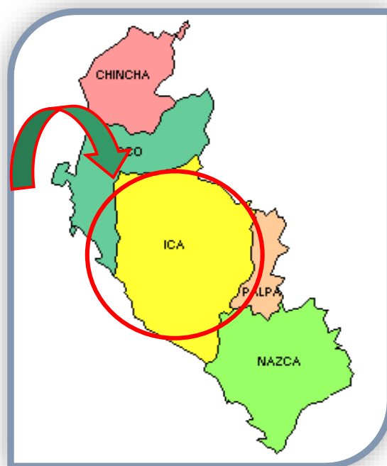
GRAFICO: 2.1.02