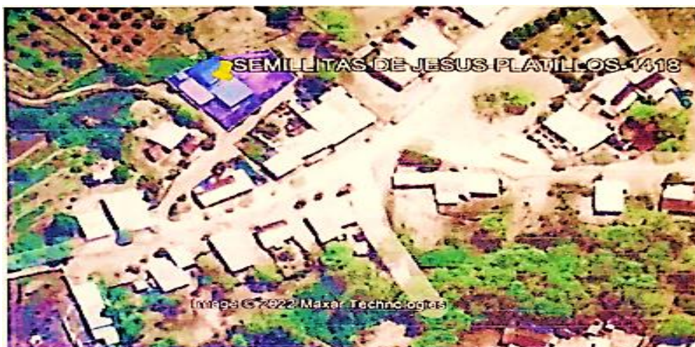
Fig. 01 Ubicación de la I.E. N.º 1418

Región : Piura Provincia : Piura Distrito : Tambogrande Región Geográfica : Costa Caserío : Platillos DRE : Dirección Regional de Educación de Piura. Ugel : Unidad de Gestión Educativa local de Tambogrande Zona : Rural