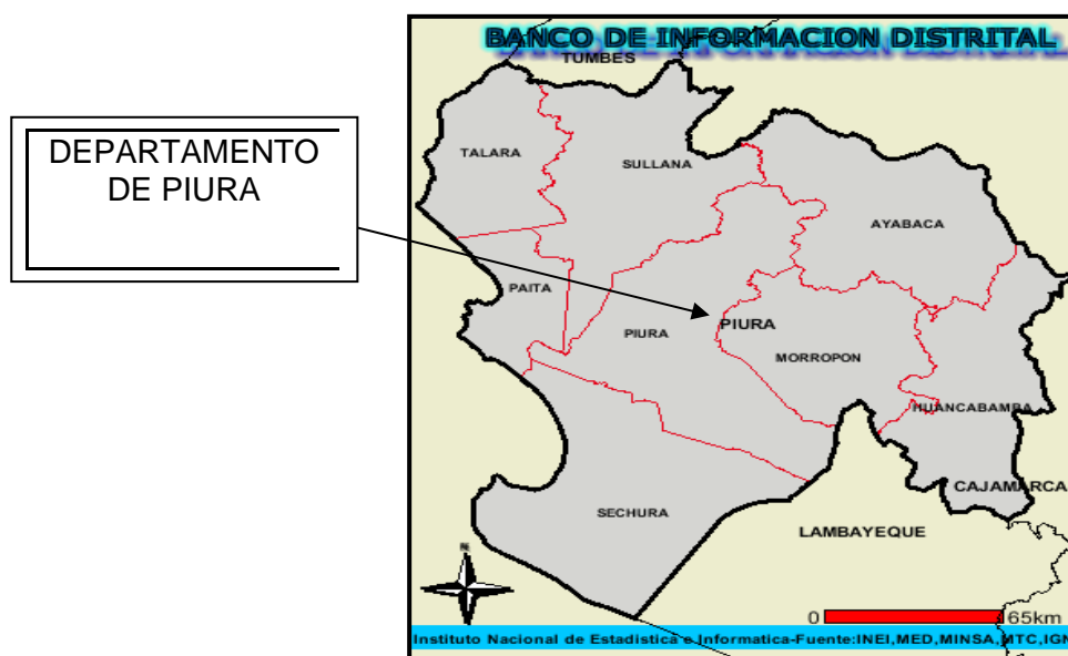
Esquema de Ubicación Geográfica en el Mapa del Distrito de Tambogrande