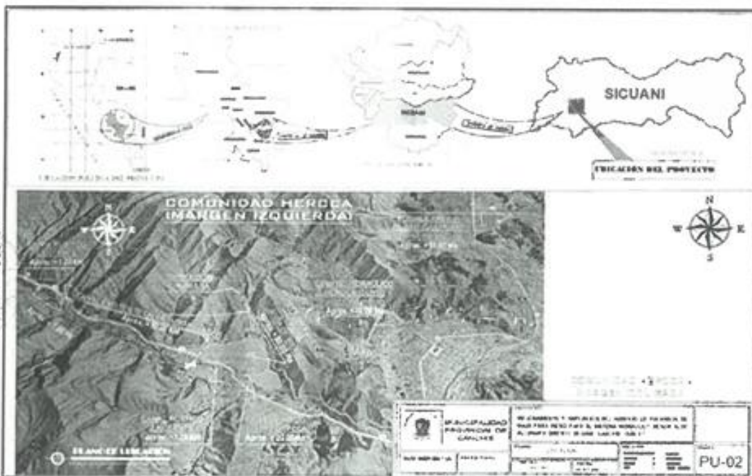
MAPA N° 3: Ubicación de micro localización del proyecto margen izquierda.