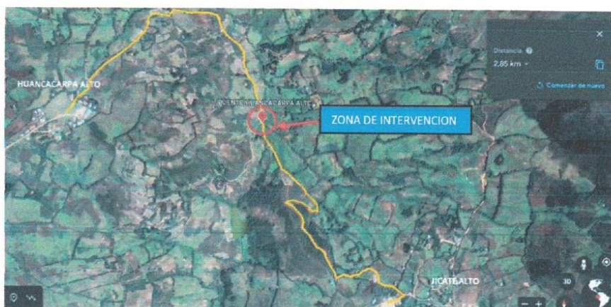
Ubicación de la zona de intervención "Puente Huancacarpa Alto" en la localidad de Huancacarpa Alto, en el camino vecinal PI 834.