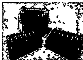
Fig. 1: Clips para cirugía laparoscópica (no incluye diseño)