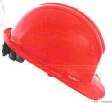
CASO DE SEGURIDAD