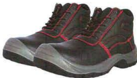
ZAPATOS DE SEGURIDAD TRABAJO – SEGURIDAD