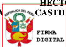
HECTOR AGRIPINO CASTILLO FIGUEROA

Firmado digitalmente por: HECTOR AGRIPINO CASTILLO FIGUEROA Hector Agripino FAU 20131312955 soft Motivo: Soy el autor del documento Fecha: 06/03/2024 23:07:06+0100