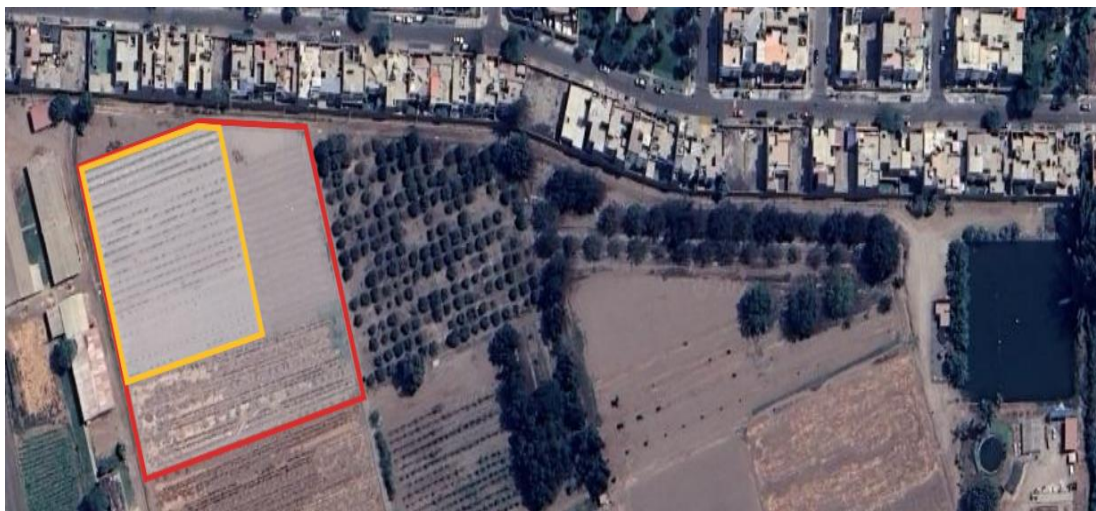
Figura 1. Campo experimental de Recursos Genéticos en el Anexo Pasiflora.

La intervención se efectuará a nivel de acondicionamiento para la implementación de un sistema de fertirriego adecuado en el campo de pre-mejoramiento, y mejoramiento genético. De la inspección realizada se ha verificado que la Estación Experimental Pasiflora cuenta con un campo experimental correspondiente al Área de Recursos en el Anexo Pasiflora el mismo que se encuentra cercado con alambres y postes en un área rectangular de aproximadamente de 1 hectárea (1,000.00 m 2 ). Sin embargo, el área de siembra solo corresponde al área cuadrangular, en la cual se instala el cultivo, la misma que representa aproximadamente un área de 3, 325.33 m 2 .