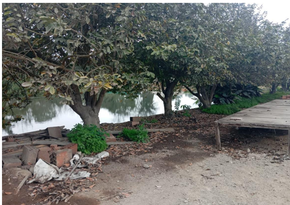
Campo de intervención donde se ejecutará el sistema de succión de agua en reservorio, en el lote 11-Colección del germoplasma de Pasifloras CELM.