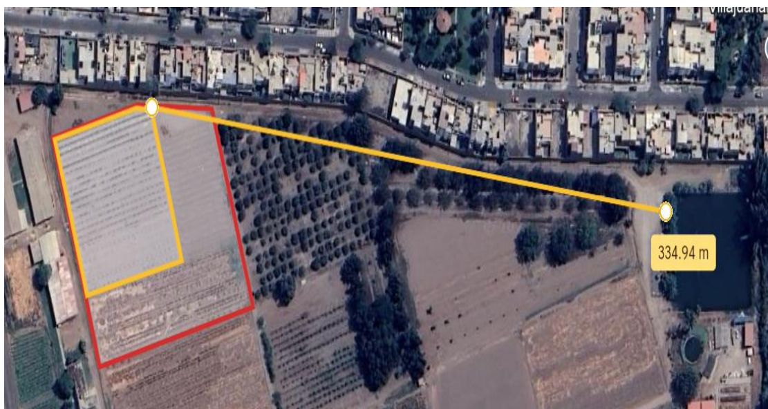
Figura 2: Distancia de sistema de fertirriego a reservorio 1 en la C.E.L.M Pasiflora.

El área donde se encuentra ubicado el campo experimental, se encuentra a 334.94 m de distancia y para poder abastecer con suministro de agua al sistema de fertirriego se tendrá que instalar una bomba de succión en el reservorio 1.