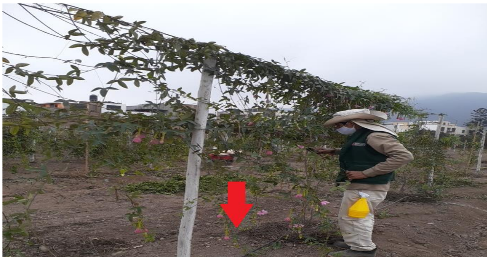
Líneas de riego de accesiones de Pasifloras (01 solo línea) en el Lote 11-Colección de Germoplasma de Pasifloras.