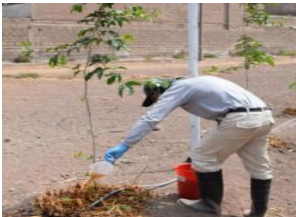
Labores de riego y aplicación de solución fertilizante en las accesiones instaladas en el Lote 11- Colección de germoplasma de Pasifloras CELM.