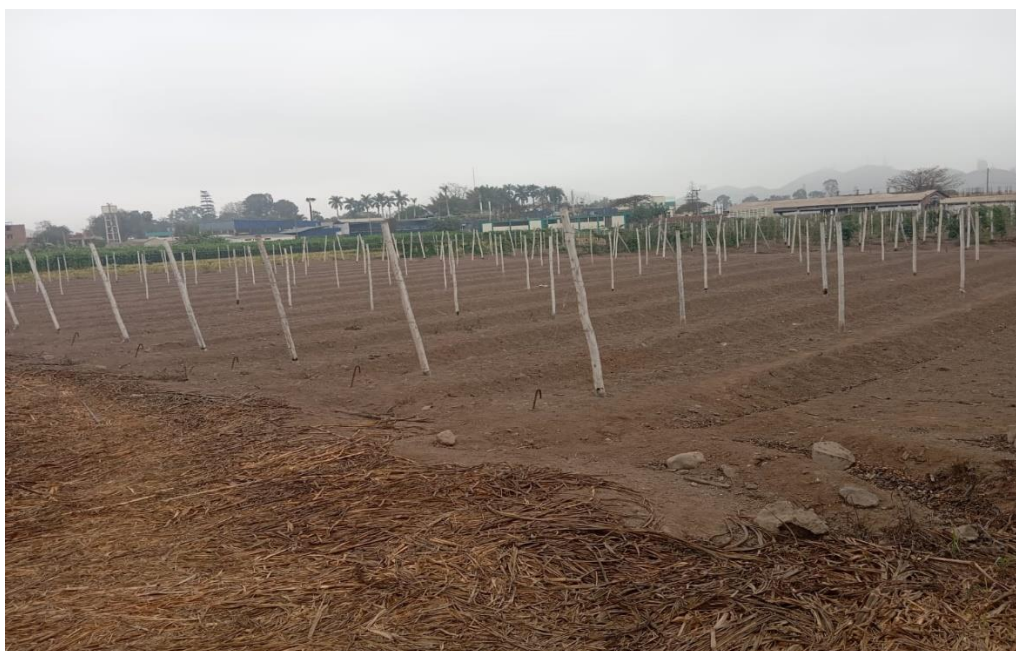
Campo de intervención donde se ejecutará el sistema de riego, en el lote 11-Colección del germoplasma de Pasifloras CELM.

"Año del Bicentenario de la consolidación de nuestra Independencia y la conmemoración de las heroicas batallas de Junín y Ayacucho "