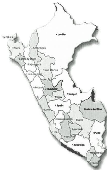
GRAFICO N°01: NACIONAL