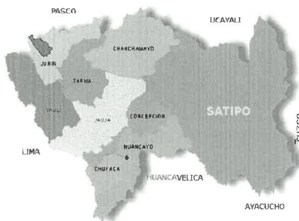
GRAFICO N°03: PROVINCIAL

DIVISION POLITICA DEL DEPARTAMENTO DE JUNIN