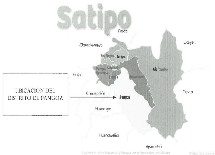
GRAFICO N°04: LOCAL

"Año del Bicentenario, de la consolidación de nuestra Independencia, y de la conmemoración de las heroicas batallas de Junín y Ayacucho"