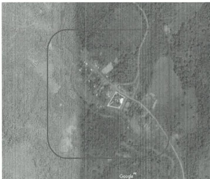
Centro Poblado Bajo Kiatari / I.E.I. 31395