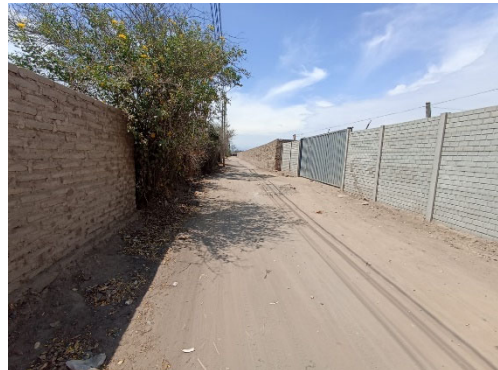
Calle el Carmen