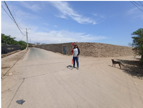
AV. Las Nazarenas