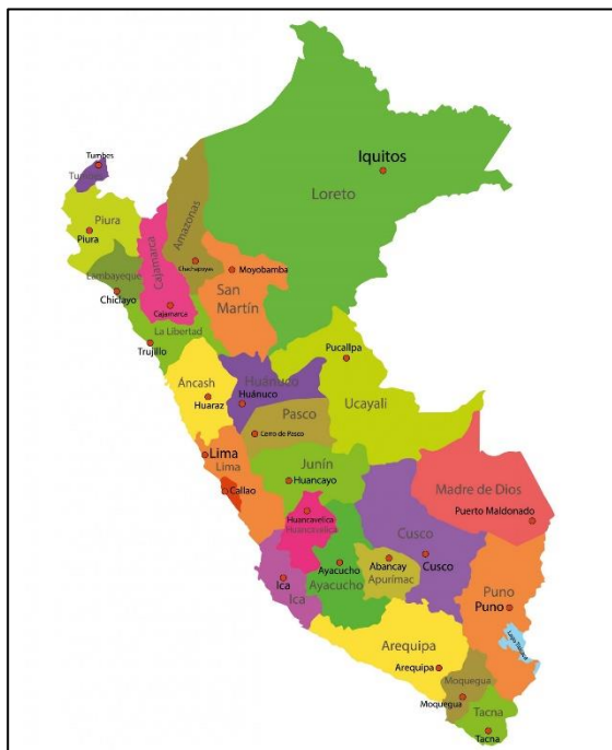
MAPA DEL PERU