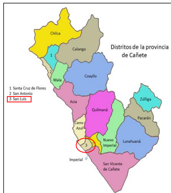
PROVINCIA DE CAÑETE