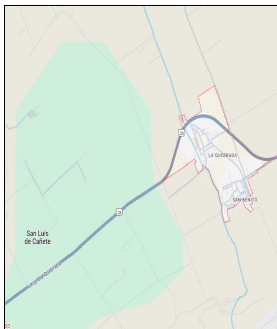
LOCALIDAD LA QUEBRADA