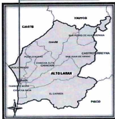
Provincia de Chincha-Sunampe