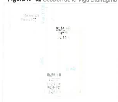
Figura N° 02 Sección de la Viga Diafragma

Los estribos planteados son de concreto armado f'c=280 kg/cm 2 los cuales tendrán la función de transmitir las cargas hacia el terreno además de servir como soporte al empuje lateral causado por el terreno, se construirán dos estribos ubicados en los extremos del puente proyectado con las siguientes dimensiones según los cálculos de diseño realizados que se presentan en la siguiente imagen