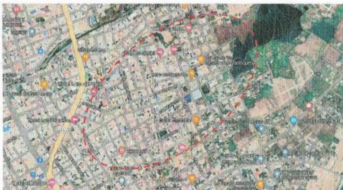
IMAGEN 02: IMAGEN SATELITAL DE LA UBICACIÓN DEL PI DENTRO DE LA CIUDAD DE JAÉN.