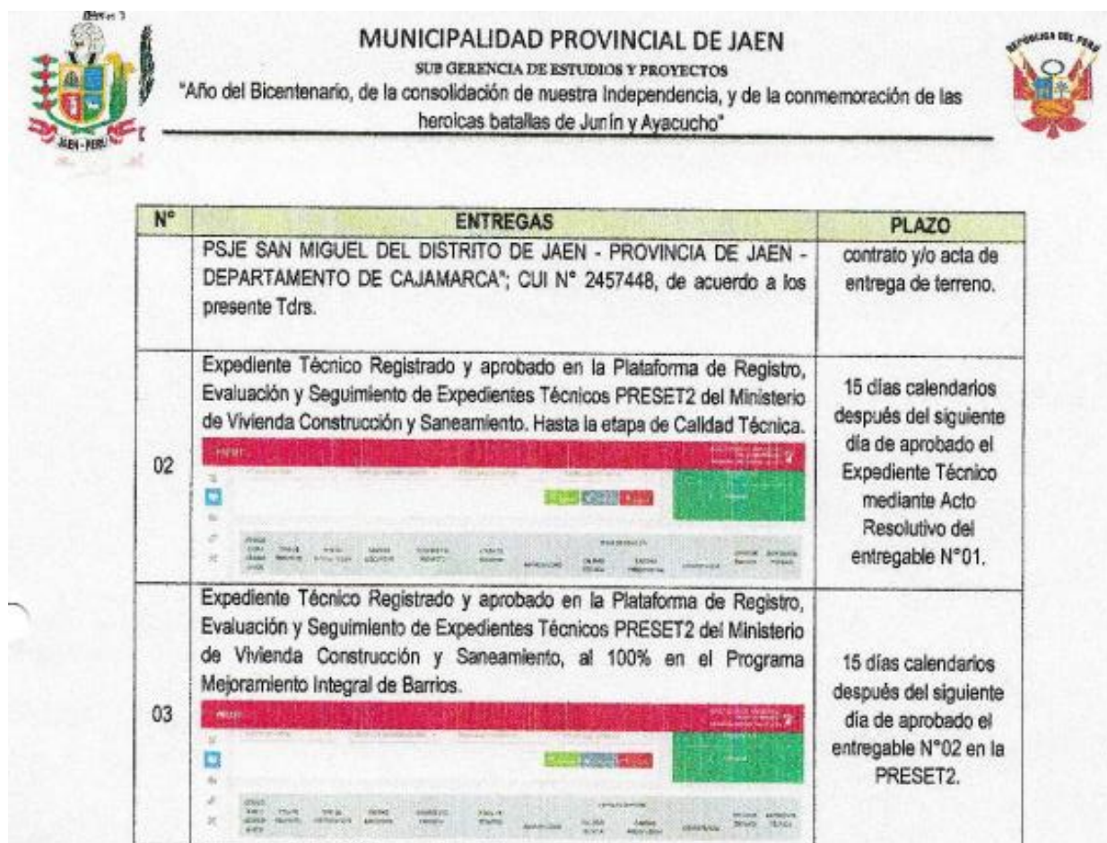
Cuadro N° 03: Plazos de entrega de productos.