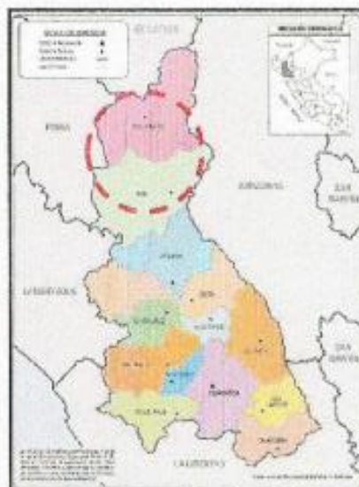
IMAGEN 01: LOCALIZACIÓN GEOGRÁFICA DEL DEPARTAMENTO DE CAJAMARCA Y PROVINCIA DE JAÉN

Calle Fernando Belaunde Terry cuadra 01 hasta la cuadra 09, calle los Ficus, calle la Betania cuadra 01 y 02, pasaje Abel Chávez, pasaje Isaac Newton y pasaje San Miguel, del distrito de Jaén.