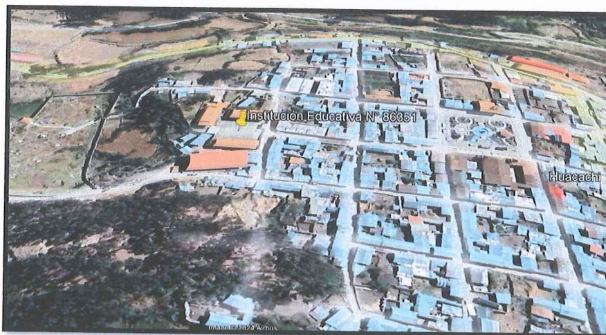
Lugar del proyecto.

El acceso a la localidad de Huacachi desde la ciudad de Huaraz, se encuentra descrita según el cuadro que a continuación de detalla: